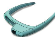
Automatic Eye Drop Dispenser